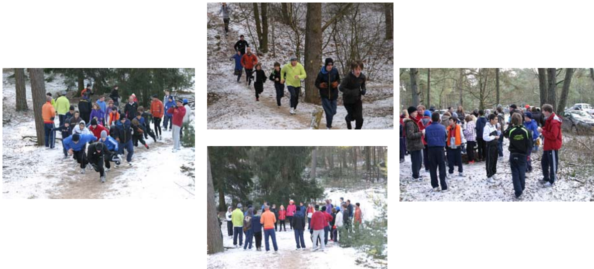
Foto's van de Oliebollen Bostraining.

(Foto's en video's zijn te bewonderen op de website www.TopJudoUtrecht.nl )