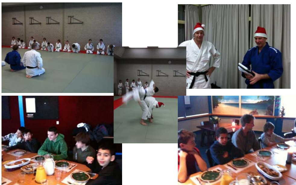
Foto's van de Kerstraining en het kerstontbijt.

(Foto's en video's zijn te bewonderen op de website www.TopJudoUtrecht.nl )